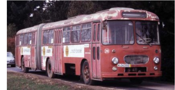
Büssing-Emmelm. ex Stadtw. Konstanz 28