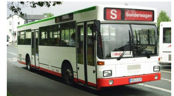
MAN SL202 ex DSW21 1912