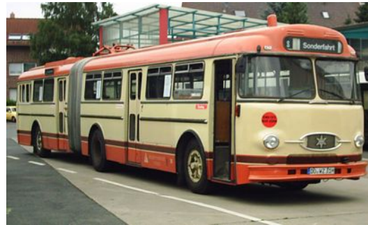
Henschel ex Stadtwerke Trier 30