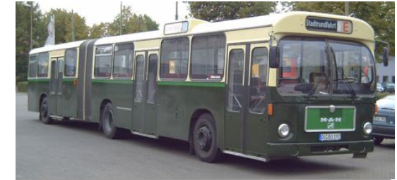
MAN SG192 ex VG Bremerhaven 214