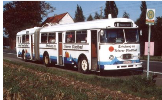
Henschel ex Stadtwerke Trier 29